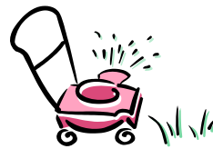
la domenica mattina