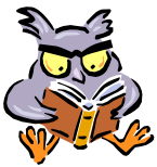
il lunedì pomeriggio/sera