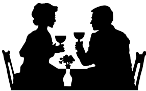
il sabato sera