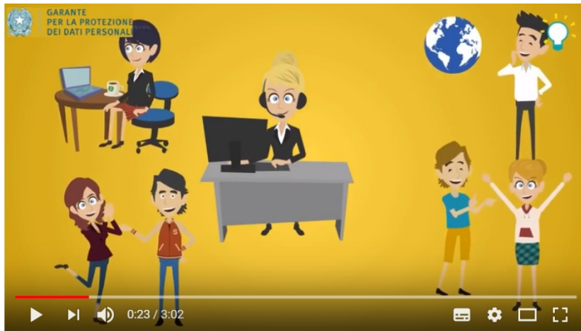
Social network: quando ti connetti, connetti anche la testa!

https://www.youtube.com/watch?v=BqtnYcfgLbM